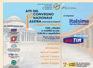
1° CONVEGNO NAZIONALE Napoli 2002