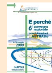
6° CONVEGNO NAZIONALE Napoli 2009