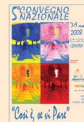
5° CONVEGNO NAZIONALE Genova 2008