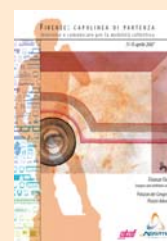
4° CONVEGNO NAZIONALE Firenze 2007