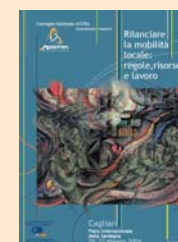
2° CONVEGNO NAZIONALE Cagliari 2004