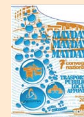
7° CONVEGNO NAZIONALE Roma 2010